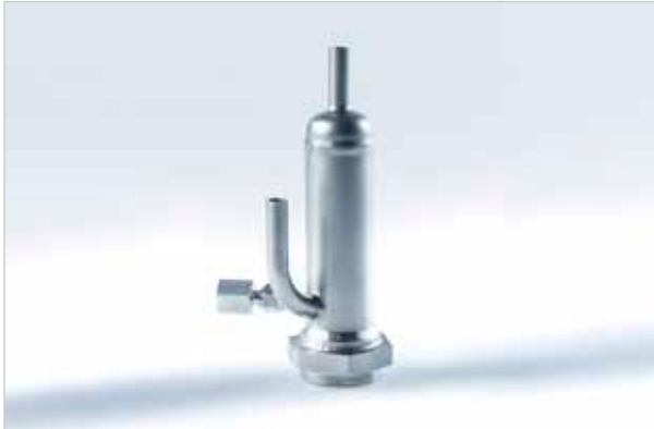
Durchflussadapter für Kältemittelanwendungen

Für die einfache Sensorintegration in den Prozess ist der Durchflussadapter ideal. Dieser ist in verschiedenen Bauformen erhältlich. Beim Ein- und Auslauf handelt es sich standardmäßig um ein Rohr mit 12 mm Durchmesser (OD), das mit passenden Fittingen bestückt werden kann. Zusätzlich ist die Integration eines Drucksensors im Adapter vorgesehen.